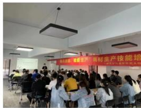
员工安全知识培训